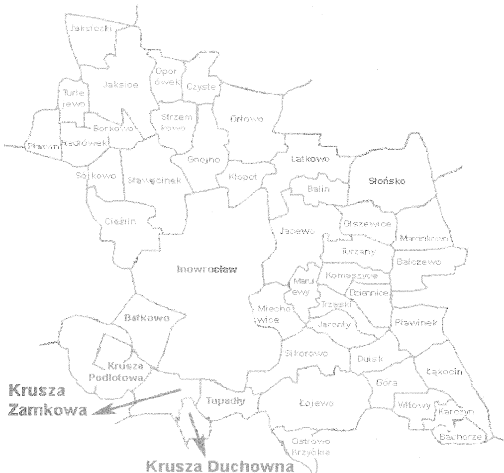
Położenie Sołectwa Krusza Duchowna Krusza Zamkowa na terenie gminy Inowrocław

Charakterystyczne elementy tej wsi to budynek starej Szkoły – obecnie siedziba świetlica wiejska, Stacja Paliw, Młyn oraz przecinająca ją na pół droga krajowa z chodnika po obu stronach