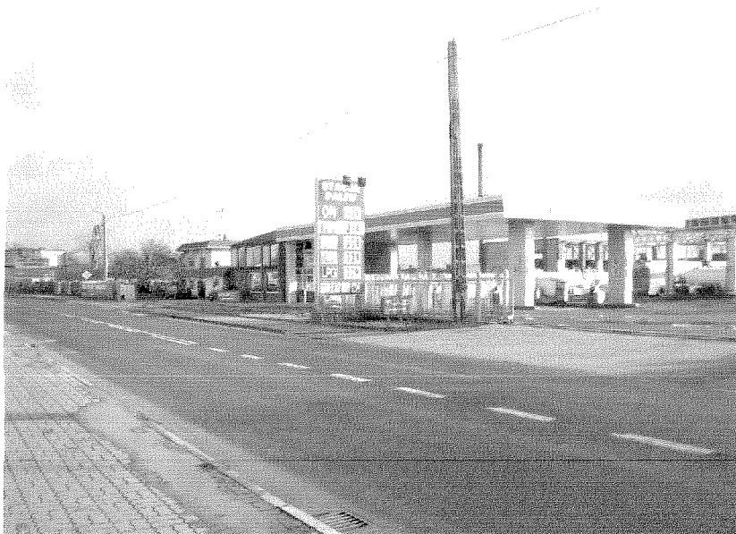
Stacja Paliw w Kruszy Duchownej

Na terenie wsi zauważalne jest powstanie nowych firm. Spowodowane jest to głównie lokalizacją na terenach podmiejskich miasta Inowrocławia oraz niższymi podatkami niż w mieście Inowrocław.