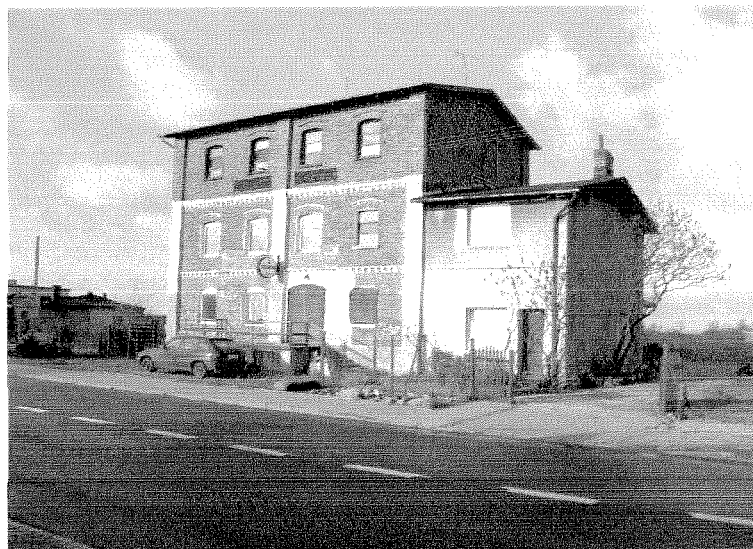
Młyn w Kruszy Duchownej

Zgodnie ze Studium Uwarunkowań i Kierunków Zagospodarowania Przestrzennego Gminy Inowrocław, teren wsi Krusza Duchowna zaliczony został do obszaru funkcjonalnego A-IV strefy rolniczo-osadniczej.