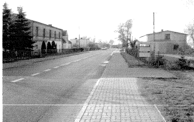
Droga krajowa 25 przecinająca Kruszę Duchowną

Krusza Duchowna jest położona na terenie Kujaw Zachodnich, tzw. Czarnych Kujaw, co oznacza, że rolnicy dysponują tu glebami o najwyższych klasach bonitacyjnych (najczęściej II i III klasa gleb).