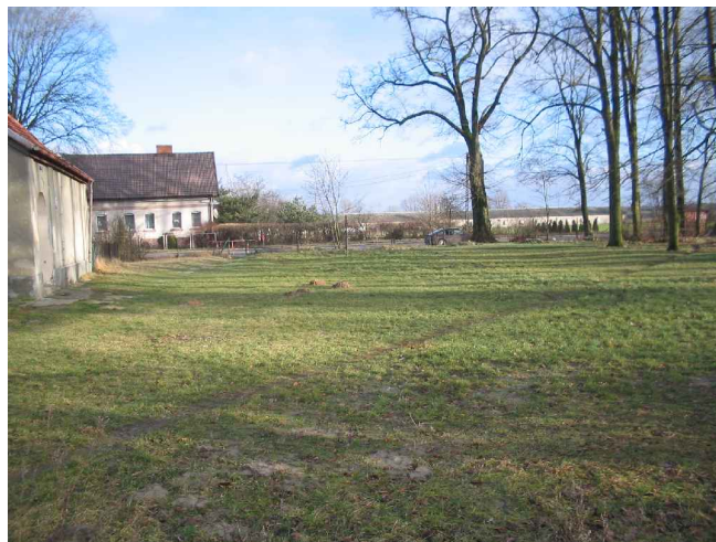
Teren wokół starej Szkoły w Balczewie