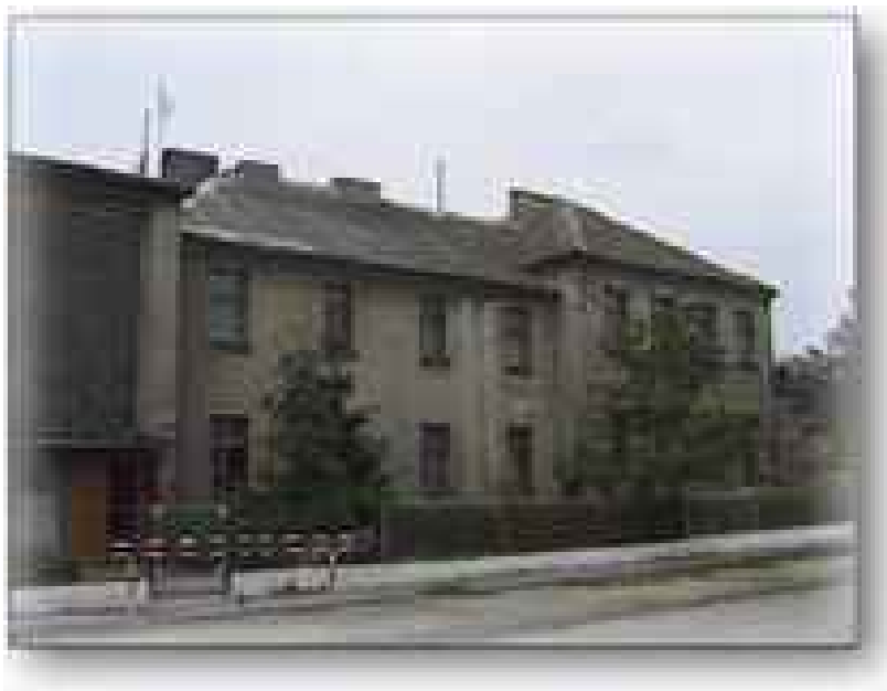
Budynek Szkoły Podstawowej im. Stanisława Przybyszewskiego

W Łojewie, w nieistniejącym już budynku szkoły urodził się 7 maja 1868 jeden z najwybitniejszych pisarzy Młodej Polski – Stanisław Przybyszewski. Został pochowany na cmentarzu parafialnym w pobliskiej Górze - na płycie grobowca wyryto napis: "Meteor Młodej Polski". Na budynku Szkoły Podstawowej w Łojewie nazwanej imieniem poety wmurowaną w latach sześćdziesiątych tablicę pamiątkową. Stanisława Przybyszewskiego na swojego patrona wybrało również Towarzystwo Rozwoju Łojewa.