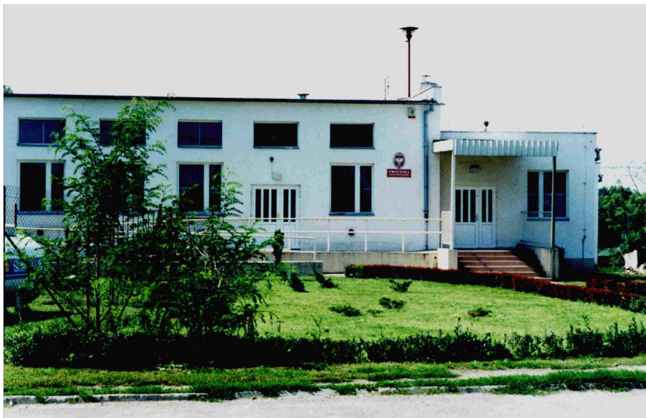
Dom Kultury i Rekreacji w Łojewie

Dzięki inicjatywie mieszkańców powstał Dom Kultury, Sportu i Rekreacji, którym opiekuje się Szkoła Podstawowa, a który umożliwia spotkania i pracę wszystkich wiejskich organizacji.