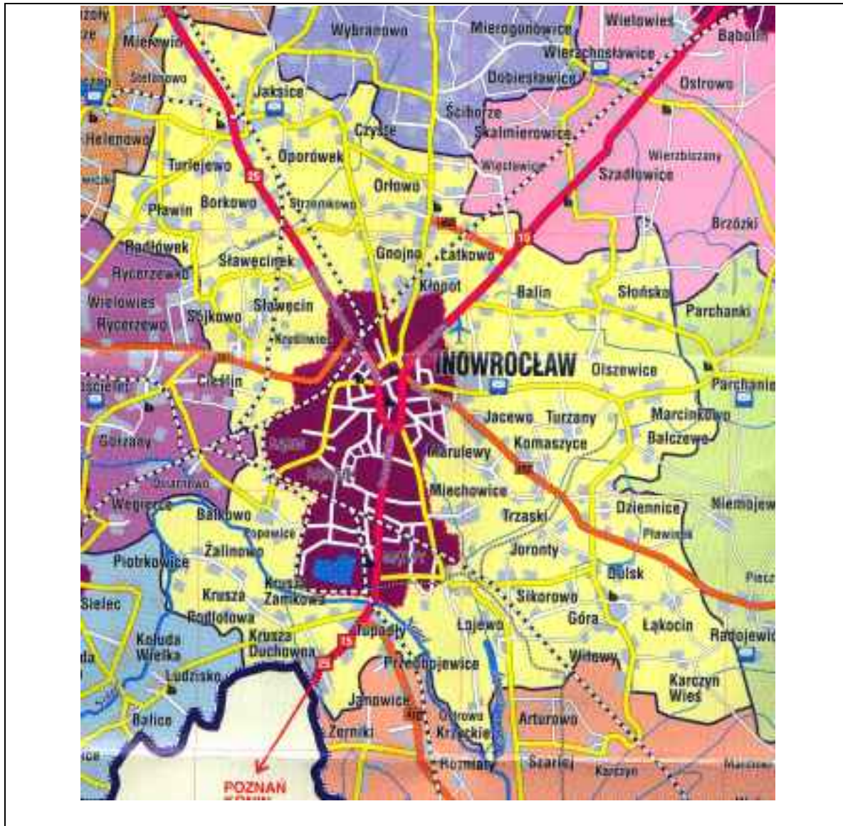
Mapa okolic Inowrocławia