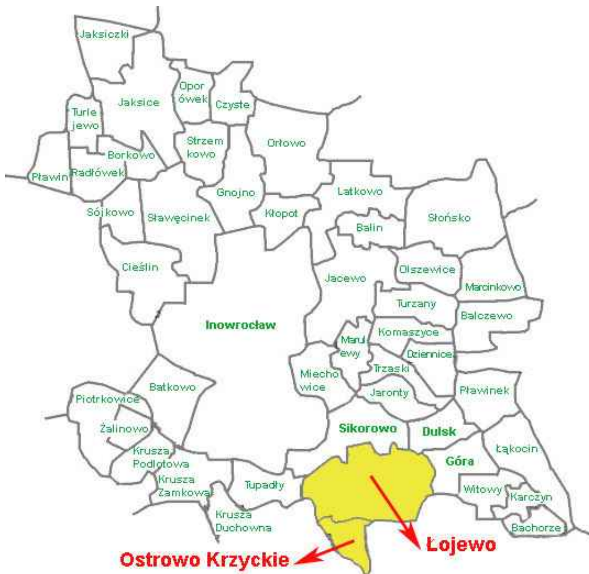
Położenie sołectwa Łojewo na terenie Gminy Inowrocław